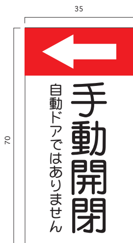
品番 OR-0401(プレート) 品番 OR-0402(ステッカー)