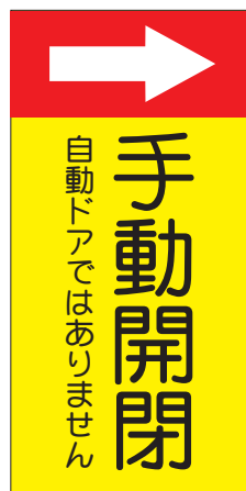
品番 OR-0407(プレート) 品番 OR-0408(ステッカー)

FAXでの注文の際はお手数ですがプリントアウトして必要事項を明記の上送信して下さい。