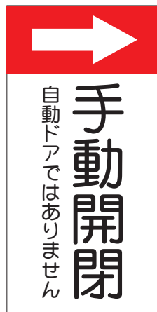
品番 OR-0403(プレート) 品番 OR-0404(ステッカー)